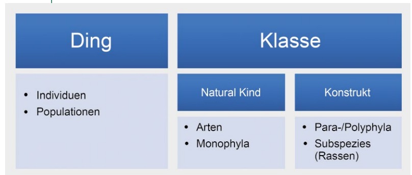
ABB. 1 | ONTOLOGISCHER STATUS DER WESENTLICHEN EINHEITEN DER BIOLOGISCHEN SYSTEMATIK

Es können Dinge (konkrete, reale Objekte) von Klassen (abstrakte Objekte) unterschieden werden. Individuen, d. h. einzelne Organismen, stellen Dinge dar, ebenso wie Populationen, da diese als integrale Systeme agieren. Es können ferner zwei verschiedene Arten von Klassen unterschieden werden: Natural Kinds (Natürliche Sorten) sind Klassen, die durch Eigenschaften definiert sind, die natürlichen Gesetzmäßigkeiten folgen. Dies sind Arten und monophyletische Taxa, die durch ihre exklusive Abstammung definiert sind. Konstrukte hingegen sind menschengemachte Klassifizierung, d. h. die definitorischen Kriterien folgen keinen natürlichen Gesetzmäßigkeiten, sondern entspringen der willkürlichen Klassifikation des menschlichen Geistes. Para- und polyphyletische Gruppierungen sowie Subspezies („Rassen“) stellen solche Konstrukte dar, da sie aufgrund einzelner, ausgesuchter Merkmale gruppiert werden.