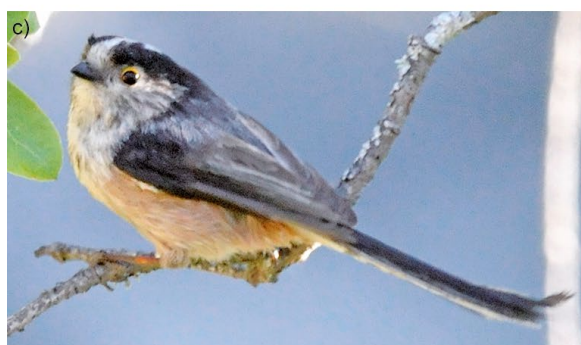
ABB. 1 Schwanzmeisen ( Aegithalos caudatus ) sind über ganz Europa bis Ostasien verbreitet und sind in mehr als 15 Rassen unterteilt, die verschiedene geografische Regionen bewohnen. Die Rassen unterscheiden sich nur in ganz wenigen Merkmalen der Kopf- und Rückenzeichnung. Hier dargestellt sind (a) die über Skandinavien, Osteuropa und Asien am weitesten verbreitete Rasse „caudatus“ mit völlig weißem Kopf, (b) die mitteleuropäische Rasse „europaeus“ mit einer schwarzen Binde über den Kopf und (c) die südspanische Rasse „irbii“ mit einem grauen Rücken.